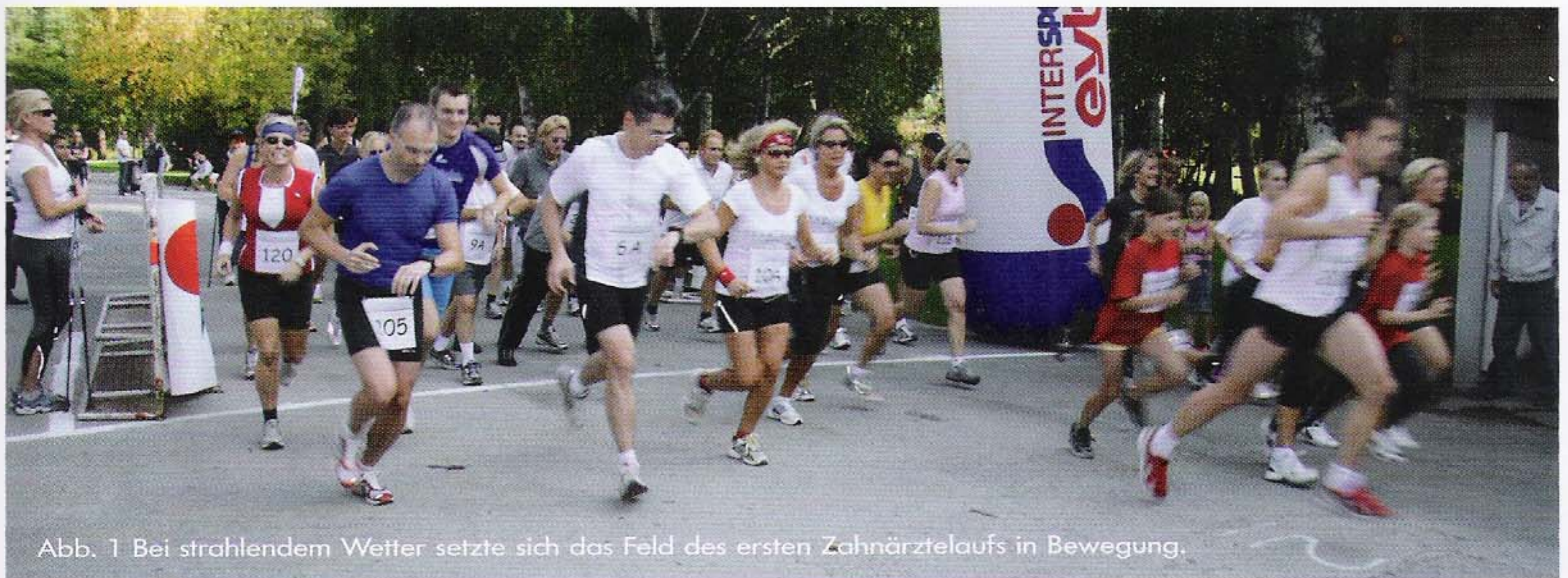
Abb. 1 Bei strahlendem Wetter setzte sich das Feld des ersten Zahnärztelaufs in Bewegung.

Aufgrund der zahlreichen positiven Rückmeldungen der Teilnehmer und Zuschauer ist eine Wiederholungsveranstaltung im nächsten Jahr durchwegs möglich. Wir werden Sie rechtzeitig darüber informieren. Weitere Bilder der Veranstaltung, sowie die Platzierungen sind unter www.dentalstudio.at ersichtlich. □